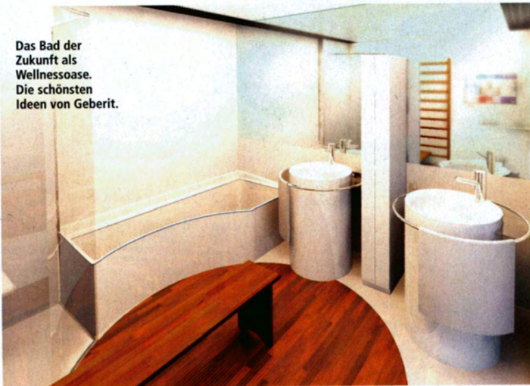
Das Bad der Zukunft als Wellnessoase. Die schönsten Ideen von Geberit.