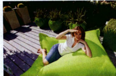
Von 25. bis 29. August findet die Gartenbaumesse Tulln statt.